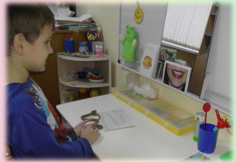
Уголок познавательного развития